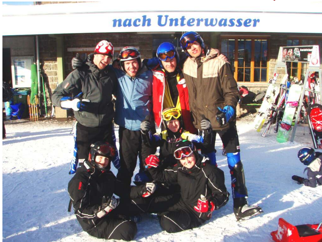
Foto z 2.kola Evropského poháru v lyžování neslyšících 2009 –Švýcarsko. Skivelo Olomouc mezi 18 klubů na 2. místě v Evropě!