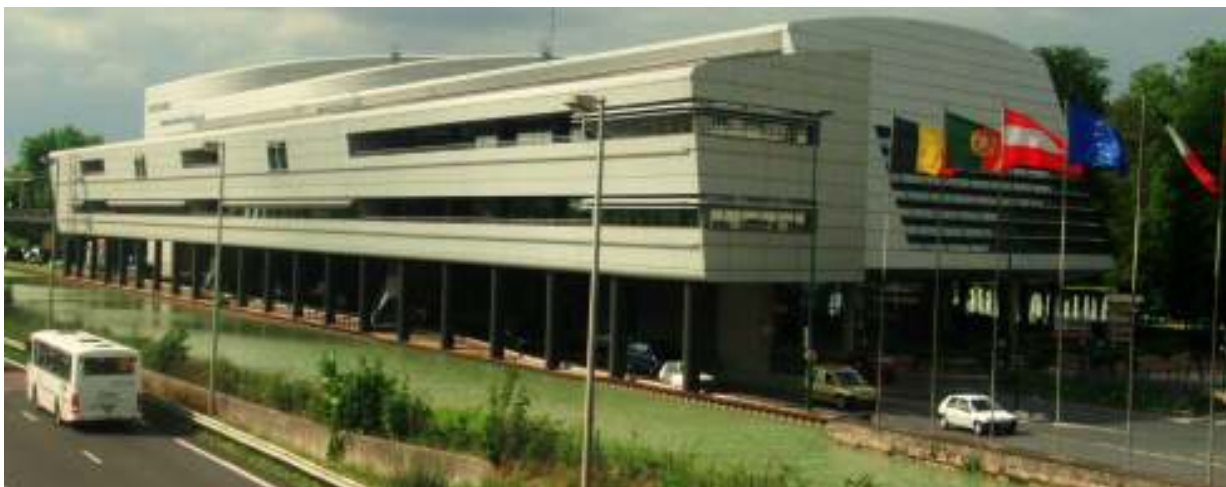
Foto: Zde se konal kulturní festival v Remis (Francie)

http://websourd.nnx.com/mediav0/public_html/catalog/index.php?cPath=39&osCsid=fb538b73aad656fb25dc3d925cd0b618