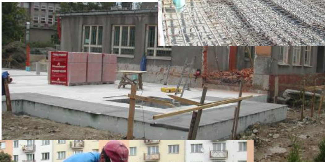
Betonová základní deska