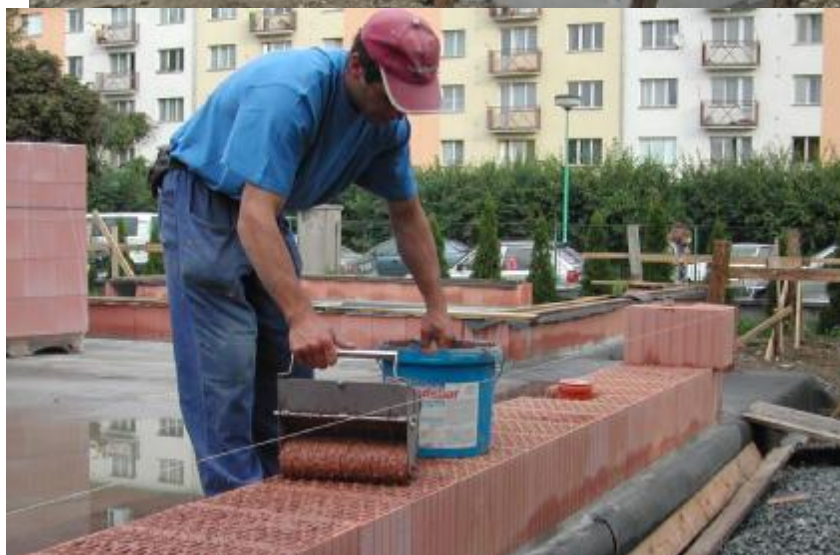
Stavba nosné zde bez použití malty/ nová technologie/